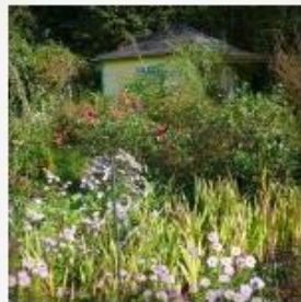
Farben im Herbst