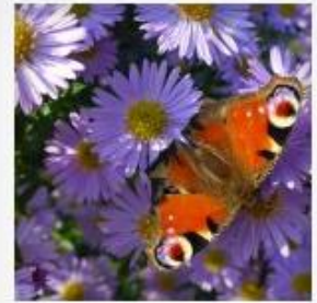
Farben im Herbst