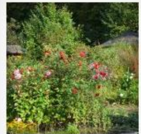
Farben im Herbst