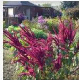
Farben im Herbst