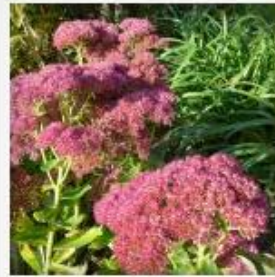
Farben im Herbst