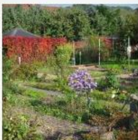
Farben im Herbst