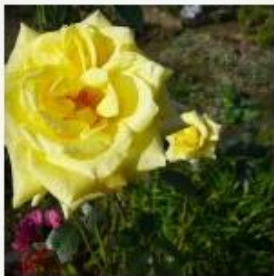
Farben im Herbst