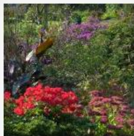
Farben im Herbst