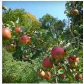
Farben im Herbst