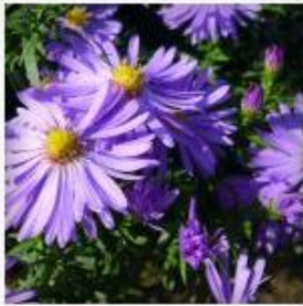
Farben im Herbst