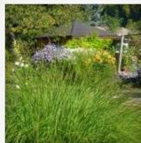
Farben im Herbst