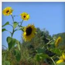
Farben im Herbst