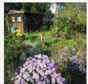
Farben im Herbst