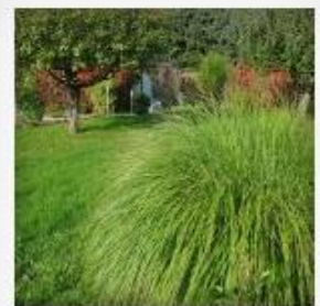
Farben im Herbst