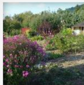
Farben im Herbst