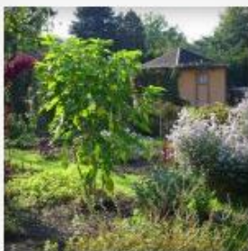
Farben im Herbst