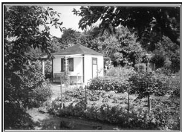
Pillnitzer Laube mit überdachtem Freisitz

Wenn die Zeitläufe eine gewisse Vielfalt bei der Laubenform gebracht haben, sollte in Zukunft darauf geachtet werden, dass diese Vielfalt eine gewisse Harmonie ergibt und sich unauffällig in die sensible Umgebung einfügt. Wünschenswert ist, dass die „Pillnitzer Laube“ möglichst lange das Bild mitbestimmt, was für die Eigentümer eine kleine „denkmalpflegerische“ Herausforderung darstellt.